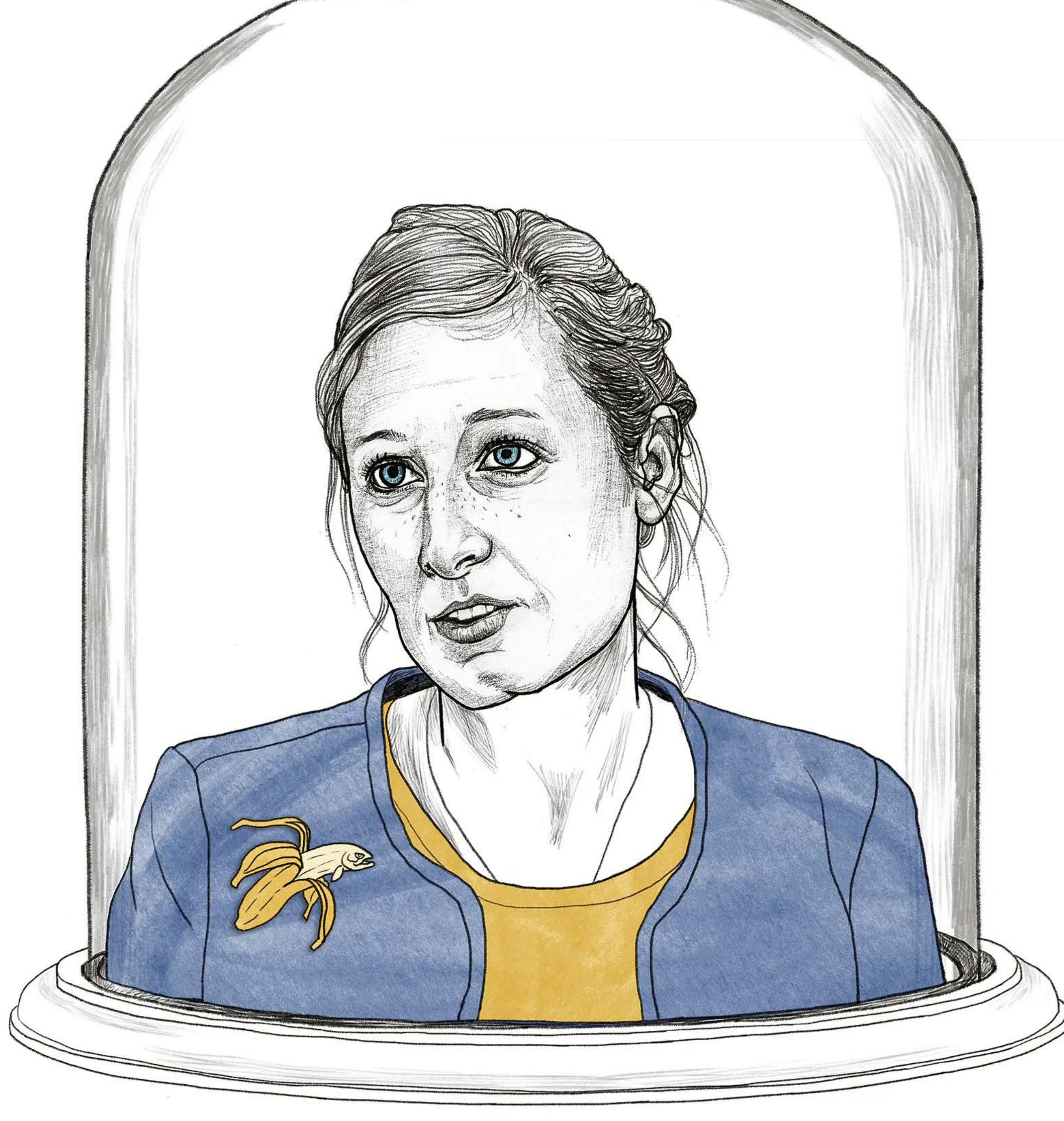
illustratie Ted Struwer

Op de eerste pagina van Femke Brockhus' tweede roman Kleine haperende vluchten menen schrijfster Julia en haar geliefde, een naamloze architect, dat ze de rust hebben gevonden. Samen met hun dochtertje zijn ze neergestreken in een huis op een heuvel, met de zee op loopafstand. Dan verdwijnt Julia. De architect wacht en 'telt de uren.' Maar ze komt niet terug.